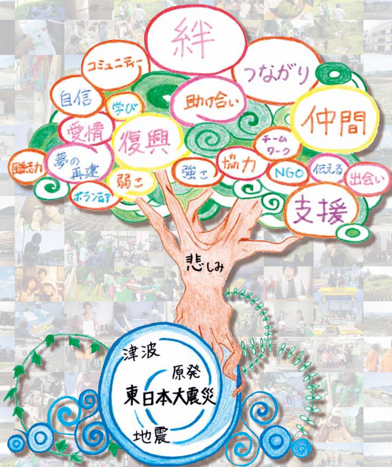
2012年 酪農学園学生ネットワーク活動総括 ～東日本大震災におけるボランティア活動～